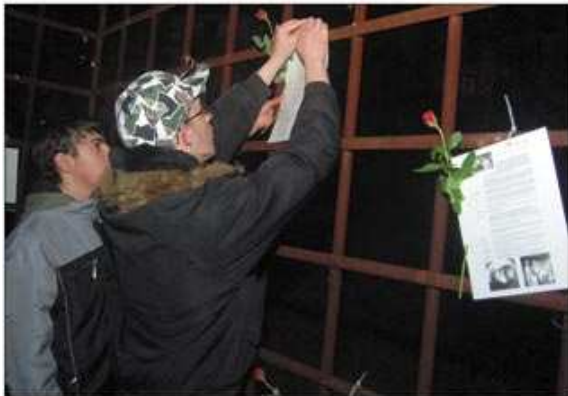
Erinnerungen an Opfer der Nazi-Zeit in Gestalt von Lebensläufen.

Am Gedenktag für die Opfer des Nationalsozialismus versammelten sich Bürger am Mahnmal am Reichensperger Platz und später in der Christuskirche in Koblenz