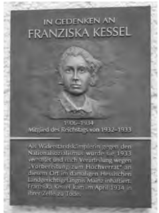
Gedenktafel für Franziska Kessel am ehemaligen Hessischen Landgerichtsgefängnis

VERANSTALTENDE: Initiative Erinnere dich, lebe Demokratie!