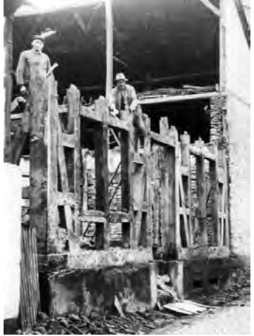
Abriss der Synagoge nach dem Novemberpogrom

Zu Beginn des 18. Jahrhunderts wurden erstmals Juden in Gemünden erwähnt. War die Anzahl der jüdischen Bewohner zunächst begrenzt, wuchs die Gemeinde im folgenden Jahrhundert so stark an, dass die Kleinstadt im Volksmund bald den Spottnamen „Klein-Nazareth“ oder „Klein-Jerusalem“ führte. Schon in den 1920er-Jahren entwickelte sich Gemünden zu einer Hochburg der NS-Bewegung, die der jüdischen Gemeinde ein gewaltsames Ende setzte.