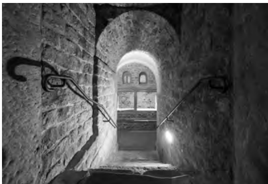
Treppenabgang zur Mikwe

TREFFPUNKT: Synagoge Beith-Schalom der Jüdischen Kultusgemeinde der Rheinpfalz, Am Weidenberg 3, 67346 Speyer