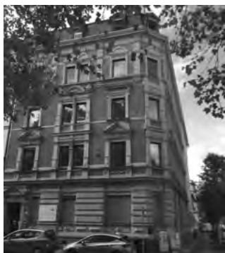
Ehemalige Gestapo-Zentrale, Kaiserstraße 31, Mainz

Obwohl die Elisabeth-von-Thüringen-Schule ihren Standort verlegt hat, hält sie an der bisherigen Praxis der jährlichen Erinnerung fest und führt Interessierte auf dem „Weg des Gedenkens und der Besinnung“ durch die Mainzer Neustadt.