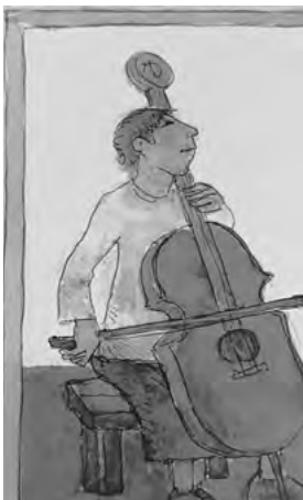
Cellistin von Auschwitz

ORT: Ehemalige Synagoge Niederzissen, Mittelstr. 30, 56651 Niederzissen