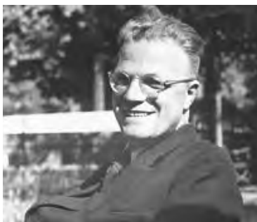
Alfred Delp

Der 1907 in Mannheim geborene und in Lampertheim aufgewachsene Jesuitenpater Alfred Delp ist einer der prominentesten christlichen Widerstandskämpfer. Delp stellte sich mit seiner regimekritischen Jugendarbeit und mutigen Predigten öffentlich gegen den Nationalsozialismus und unterstützte Juden. Darüber hinaus arbeitete er intensiv im „Kreisauer Kreis“ um Helmuth James Graf von Moltke an Plänen für den Neuaufbau Deutschlands nach dem Krieg mit, wobei er Ideen der katholischen Soziallehre einbrachte. Wenige Tage nach dem Attentat vom 20. Juli 1944 wurde Delp in München verhaftet und am 2. Februar 1945 in Berlin-Plötzensee ermordet.