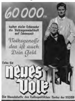
Monatsheft des Rassepolitischen Amtes der NSDAP 1937, Wikimedia gemeinfrei

ORT: Rathaus Nierstein, Riesling-Galerie, Bildstockstraße 10, 55283 Nierstein