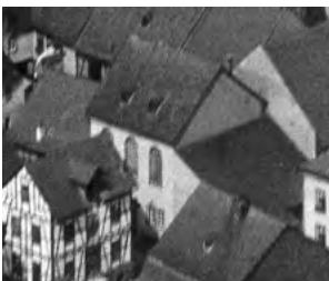
Die Synagoge von Gemünden, © Fotosammlung Morscheiser, Gemünden

VERANSTALTER: Förderkreis Synagoge Laufersweiler e. V.