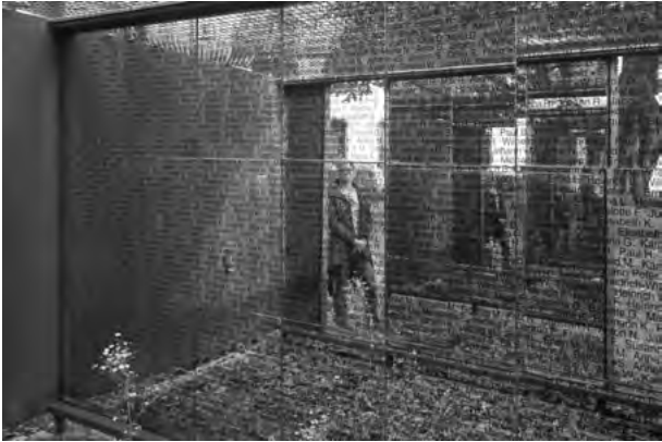
Andernacher Spiegelcontainer

ORT: Rhein-Mosel-Fachklinik Andernach, Klinikkirche St. Thomas und Andernacher Spiegelcontainer an der Christuskirche