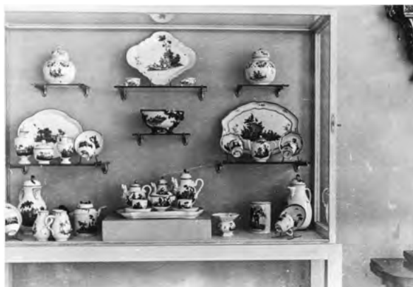
Aufnahme einer Porzellanvitrine des Altertums Museums der Stadt Mainz, 1937