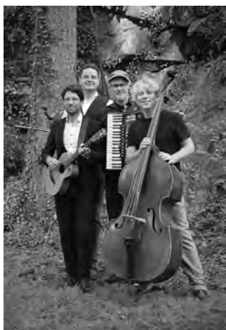
Naschuwa ©Wolfgang Schumacher