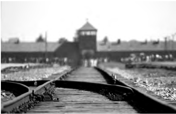
Gatehouse Auschwitz II (Birkenau)

„Auschwitz“ steht heute synonym für den Massenmord der Nationalsozialisten an Millionen von Menschen. Am 27. Januar 1945 hatten Soldaten der Roten Armee die Überlebenden des Konzentrations- und Vernichtungslagers Auschwitz-Birkenau befreit. Am 80. Jahrestag der Befreiung laden die Jüdische Kultusgemeinde Trier und der rheinland-pfälzische Landesverband Deutscher Sinti und Roma zur Gedenkstunde an die Opfer des Nationalsozialismus in das Kurfürstliche Palais in Trier ein.