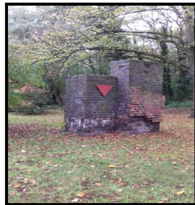
Zentralfriedhof Berlin-Friedrichsfelde. Berlin Fotos F. Pernot 2017