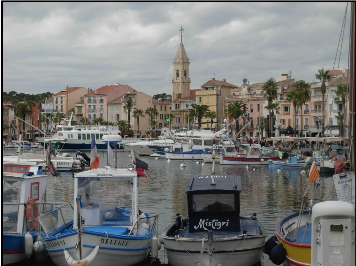
Aussicht auf Friedrich Wolfs Studio in Sanary